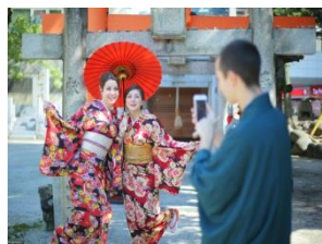
日本传统文化体验